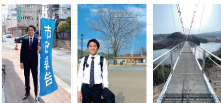
街頭演説後、ダムパークいばきたへ（吊り橋も渡りました）