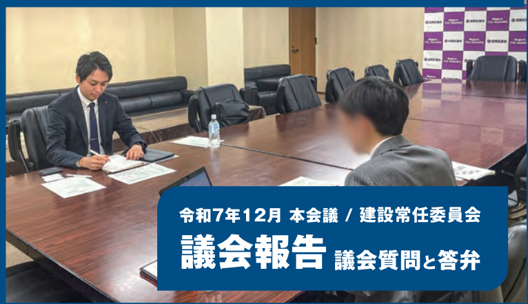
令和7年12月 本会議 / 建設常任委員会